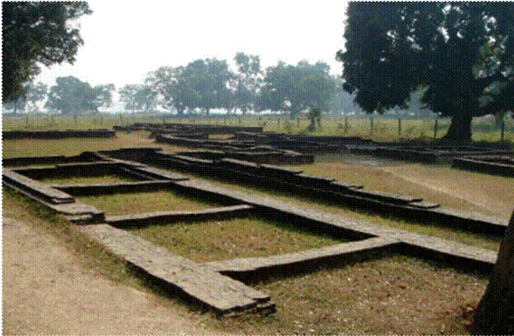
Di tích đền đài trong thành Ca Tỳ La Vệ xưa

Đức Phật Thích Ca tên là Tất Đạt Đa (Siddhartha) họ Cù Đàm (Gautama) thuộc tộc Thích Ca, ngài là một vị Thái tử, con vua Tịnh Phạn (Suddhodana) và Hoàng hậu Ma Gia (Maya), ở nước Ca Tỳ La Vệ (Kapilavatthu), xưa thuộc Ấn Độ, nay thuộc về nước Népal.