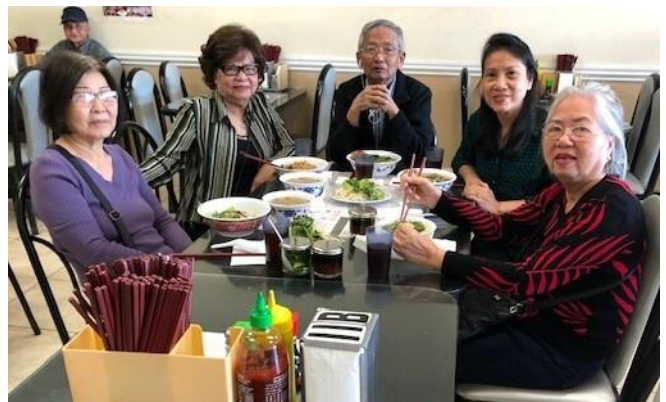
Gặp nhau ở Nam Cali