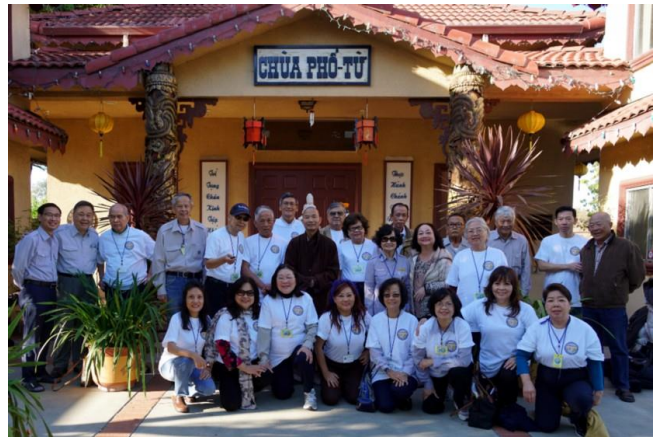
Buổi sáng chia tay trước cổng Chùa