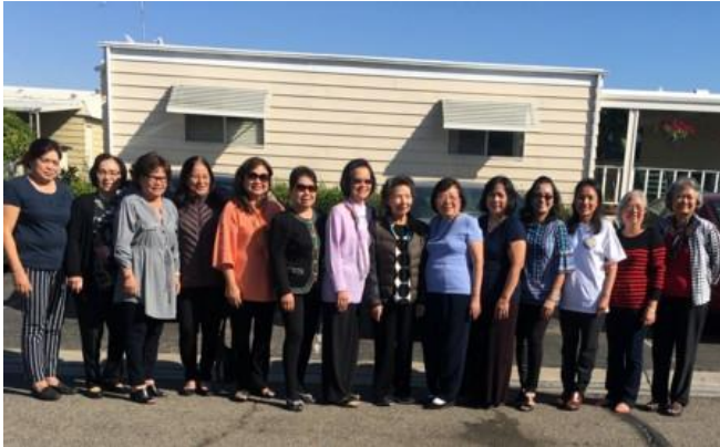
Họp mặt Nam Cali