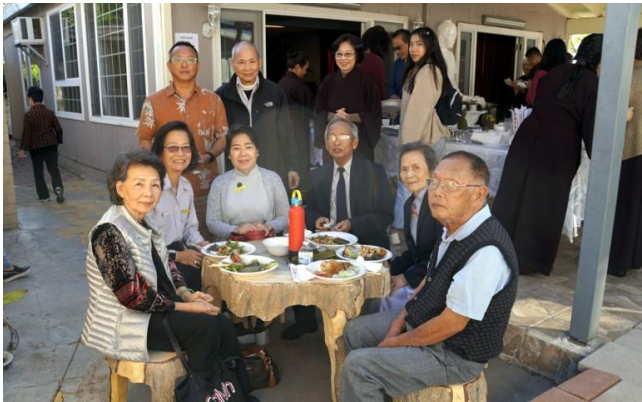
Tham dự Lễ ở Chùa Sùng Nghiêm