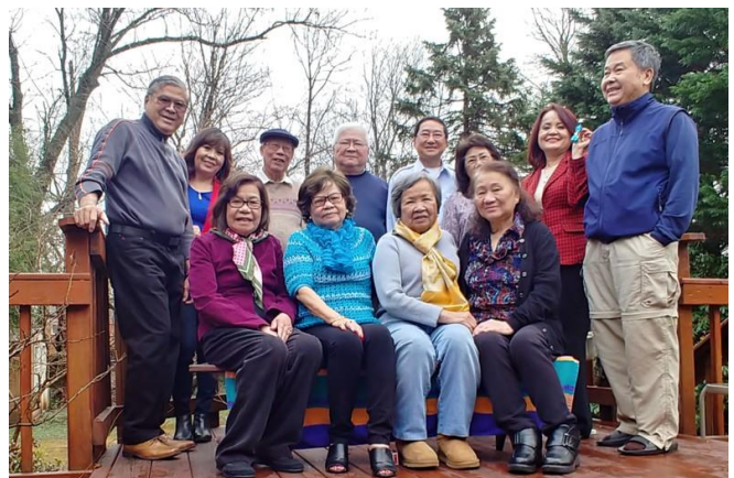
Họp mặt Miền Đông