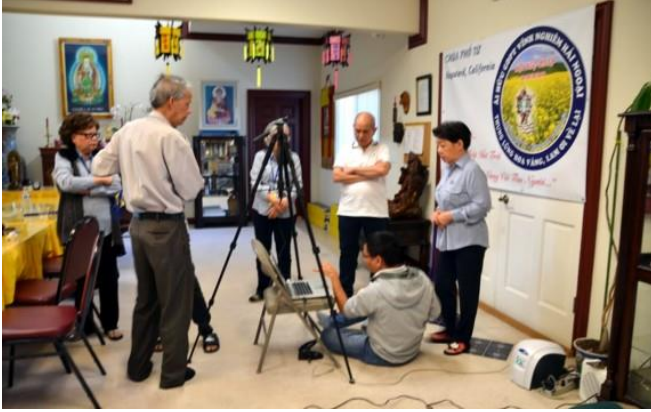
Chụp hình làm Thẻ Tham dự viên