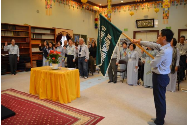
Lễ Khai mạc