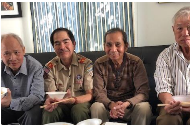
Họp mặt Nam Cali