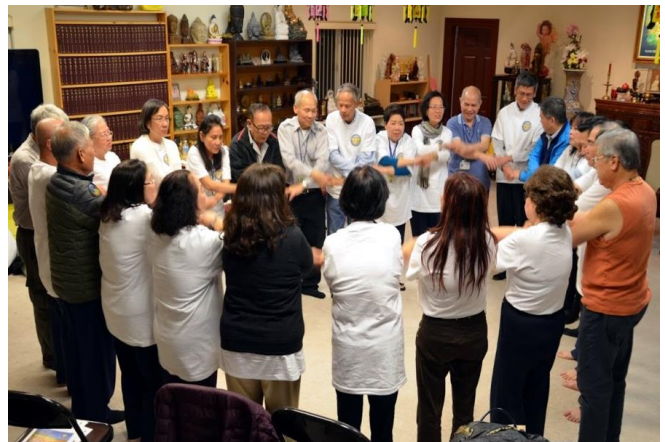
Giây thân ái