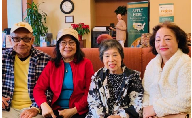
Thăm chị Nhung