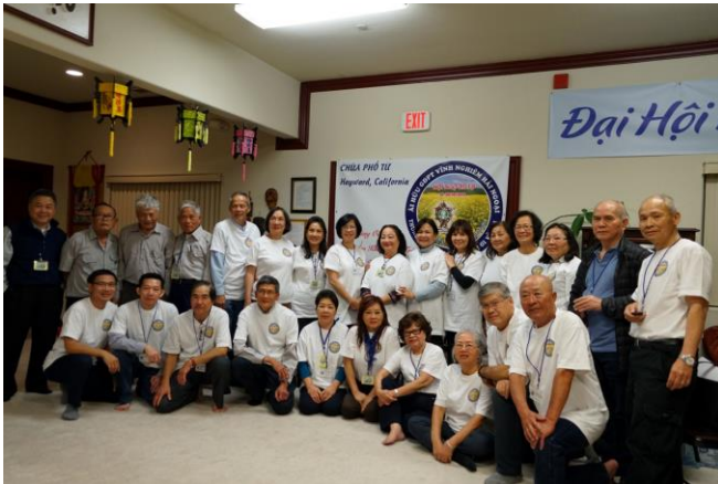
Kết thúc buổi Văn nghệ