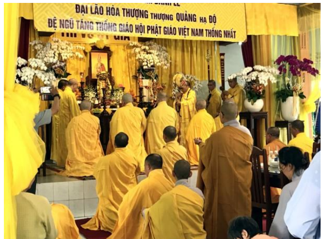
Tuần Thất 2