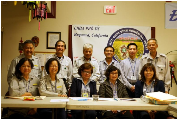
Thành phần Tân BCH

mà Ban Chấp Hành vẫn được Đại Hội yêu cầu tiếp tục nhiệm kỳ kế tiếp. Thế là lại một lần nữa các Anh Chị Em lại được yêu cầu làm thêm một nhiệm kỳ nữa!