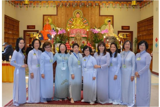
Trong Chánh điện Chùa Phổ Từ