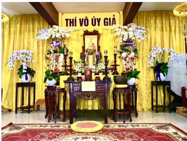
Tuần Thất 2