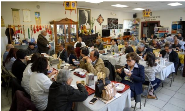
Phòng ăn của Chùa Phổ Từ