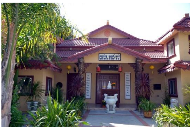
Chùa Phổ Từ

Từ lúc chia tay ở lần Hội Ngộ 2019 cho đến nay, chắc hẳn trong chúng ta ai nấy vẫn còn nhiều dư âm và kỷ niệm đẹp trong tâm tưởng của những ngày sinh hoạt chung với nhau dưới mái chùa Phổ Từ, tại Hayward, California.