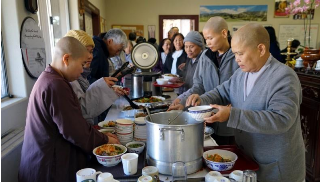
Quý Ni Sư và Sư Cô lo bữa ăn