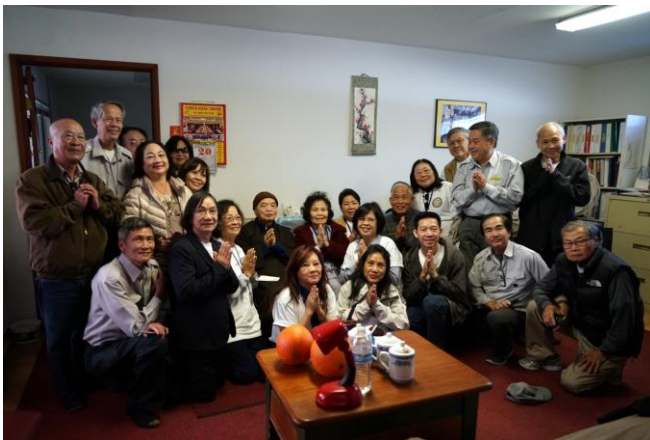
Thăm Chùa Giác Minh