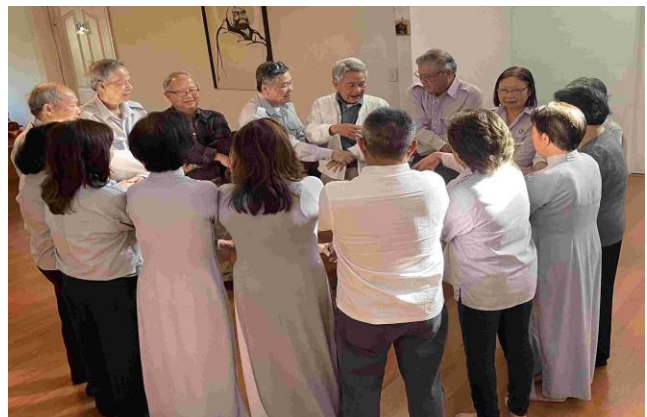
Giây Thân Ái