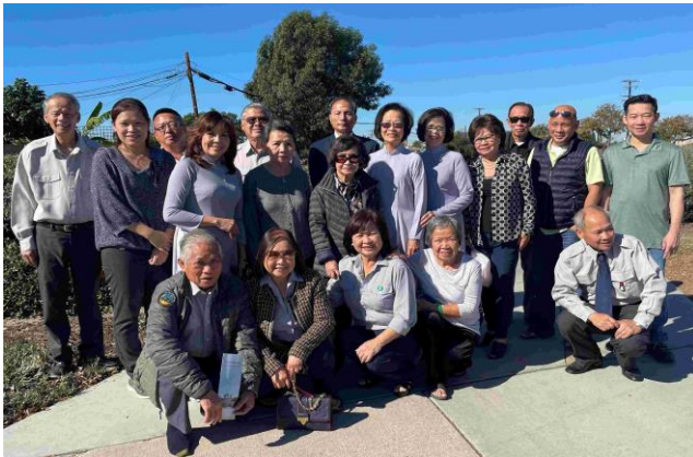
Chụp hình kỷ niệm