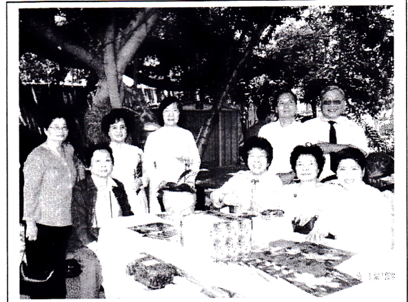
Ra mắt Kỳ Yếu nhân ngày giỗ đầu anh Thu tại chùa Liên Hoa.