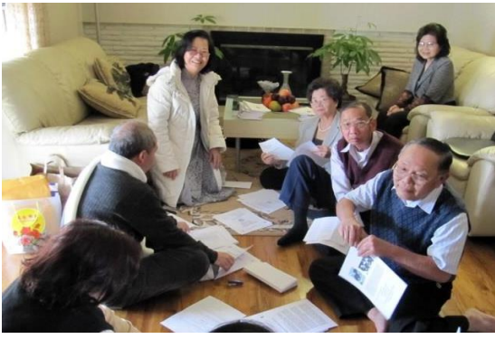
Ảnh Chị Em AHVN California đồng lòng sốt sắng khởi công cho ngày Đại Hội 9/4/2010 sắp tới.