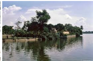
Chùa Trấn Quốc-Hồ Tây