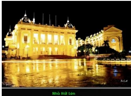
Nhà Hát Lớn Hà Nội

Vào ban đêm quanh bờ hồ thật là nhộn nhịp. Ánh đèn điện chiếu xuống hồ lấp lánh như sao. Những cây cổ thụ, cành cây vờ ra thật xa là là xuống mặt nước thật nên thơ. Ta có thể ngồi trên ghé đá nhâm nhi gói lạc rang hay hạt dẻ rang nóng hổi.