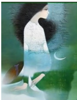
Hình minh họa

Viết đến đây tôi cứ tùm tùm cười vì không biết hồi cùng ở Triệu Việt Vương với anh, tôi và anh có cùng “yêu” chung người con gái tên Phương có người em tên Mỹ ấy không? Nếu anh biết có chuyện ấy, tôi đã bị ăn đòn của anh rồi. Tôi có về thăm căn nhà ở Triệu Việt Vương, nó tiêu điều quá. Cảnh vật nơi đó thay đổi nhiều, có cái đẹp lên có cái xấu đi, riêng cây cỏ thụ trước nhà vẫn như xưa vì nó