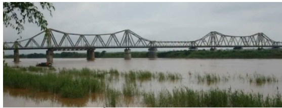
Cầu Long Biên

Bây giờ, tôi kể anh nghe kỷ niệm của tôi về ngoại thành Hà Nội nhé. Thời gian này thì tôi còn nhỏ, khoảng tám tuổi thì phải. Tôi ở Gia Quát với ông bà ngoại tôi đâu chừng hai tháng. Anh biết Gia Lâm không, bên kia cầu Long Biên đó. Gia Lâm và Hà Nội cách nhau bởi sông Hồng. Bắc qua sông Hồng là cầu Long Biên. Nay cầu này chỉ được dùng cho người đi bộ và xe đạp vì cầu quá cũ. Những loại xe nặng thì dùng cầu Chương Dương mới được xây vào những năm gần đây. Cầu Long Biên có kiến trúc đẹp, dài khoảng 3 cây số kể cả chân cầu.